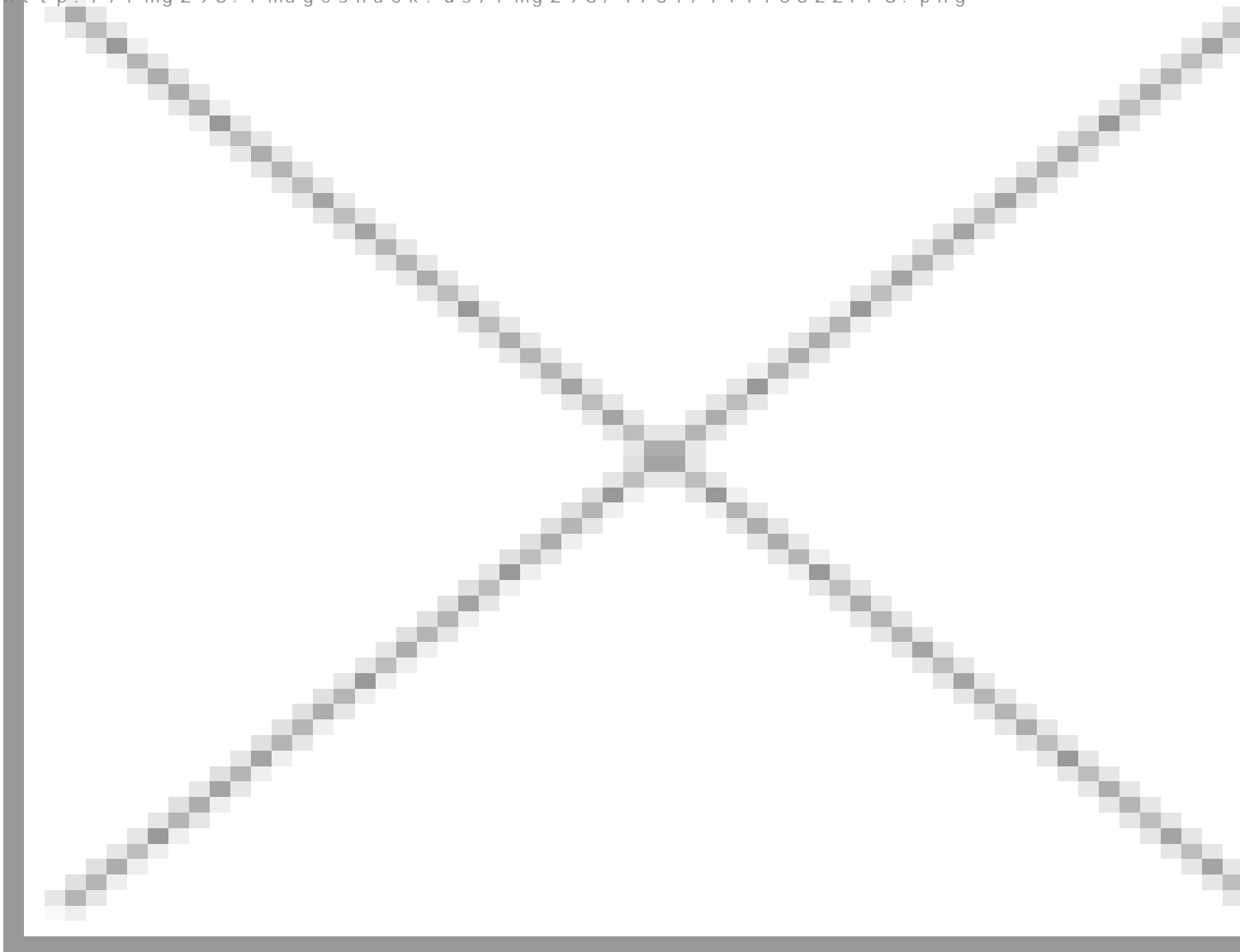
image not found http://img296.imageshack.us/img296/4701/71110522f18.png

Експериментирайте със стойностите и си го нагласете по ваш вкус. :)